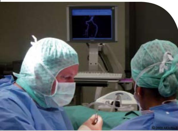
JiveX bringt Bild und Befund an jeden Arbeitsplatz

Selbstverständlich können Sie mit JiveX auch eine Patienten-CD mit Bild und Befund sowie der passenden Software für Ihren Zuweiser erstellen. Diese CD wurde auf alle gängigen EDV-Systeme angepasst und lässt sich individuell für Sie gestalten.