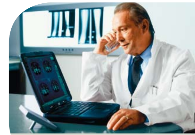
Flexibler Datenaustausch mit JiveX

JiveX ASP schafft sowohl für das Bildmanagement und Bildlogistik, als auch für umfassende telemedizinische Anwendungen die bestmögliche Lösung. Durch das neuartige Single-Point-of-Administration Konzept ist JiveX dabei extrem wartungsarm und auch in großen Netzen einfach steuerbar.