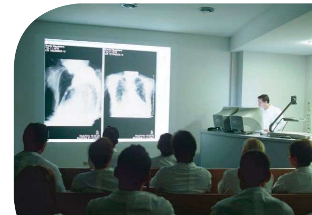
Klinische Demonstration mit JiveX

Der schnelle Zugriff auf alle Voruntersuchungen ist für Sie mit JiveX kein Problem mehr. Denn mit dem Online-Konzept stehen Ihnen alle Untersuchungen jederzeit außerordentlich schnell zur Verfügung. JiveX unterstützt die Ausgabe über mehrere Monitore oder Beamer mit hoher Auflösung und verfügt über einen speziellen Modus zur Organisation und Moderation Ihrer Präsentation.